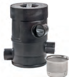
Wirbelfeinfiler Laub und Sand