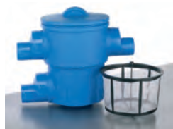
Gartenfilter XL / Basket XL