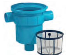
Gartenfilter / Basket 200