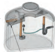
Filterplatte Typ A