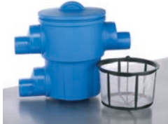
Gartenfilter XL / Basket XL