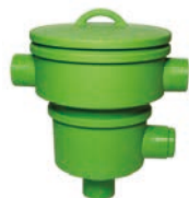
Gartenfilter / Basket 200