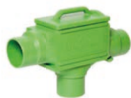
Zisternenfilter / Integral